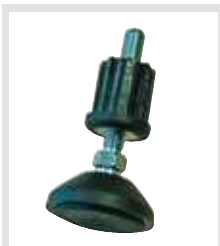
Výškově přestavitelné patky nabízené jako bezpečnostní příslušenství